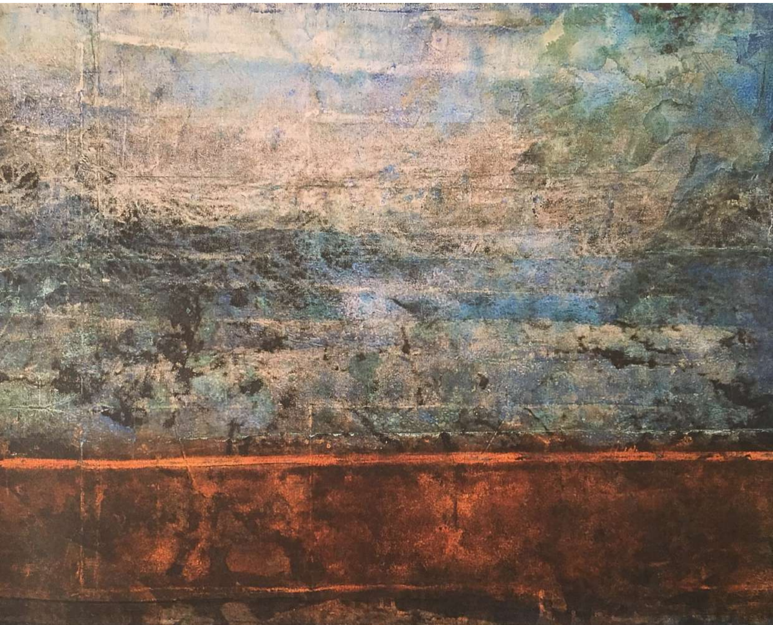
Técnica mixta sobre lino/ 240 x 98 cm/ 2009