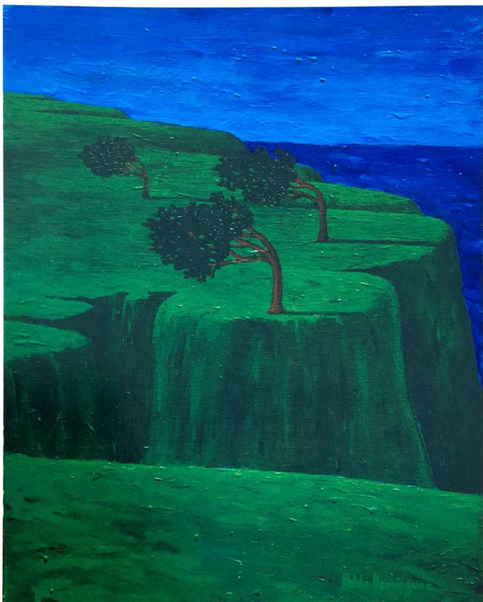
Arboles con viento Acrílico sobre tela 92 x 73 cms. 1996