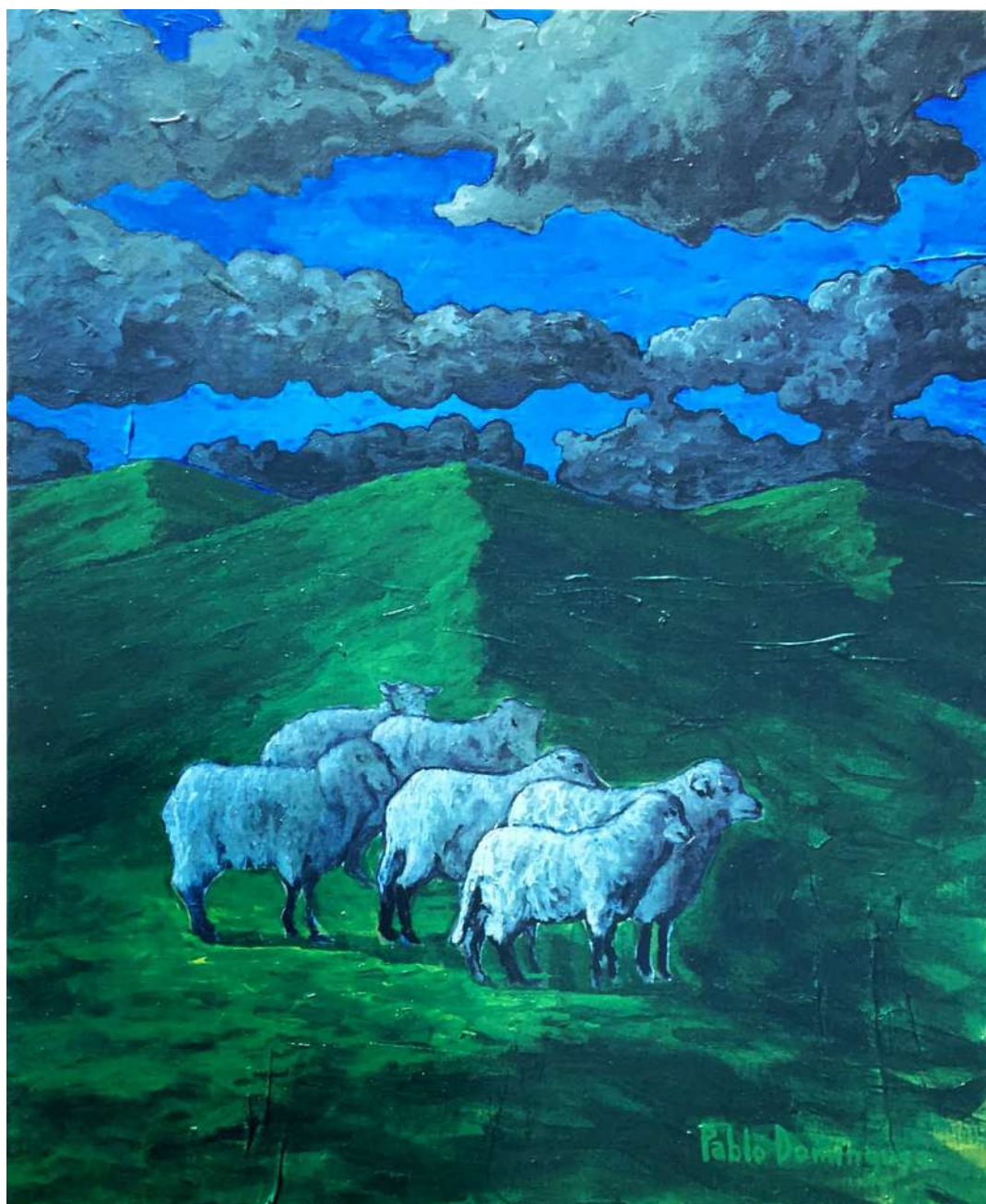
Los Corderos Acrílico sobre tela 61 x 50 cms. 1996