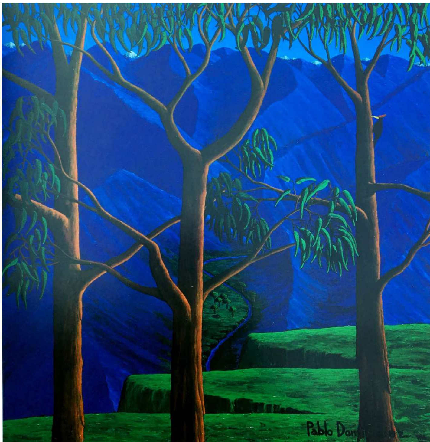
Los Eucaliptus Acrílico sobre tela 245 x 238 cms. 1995