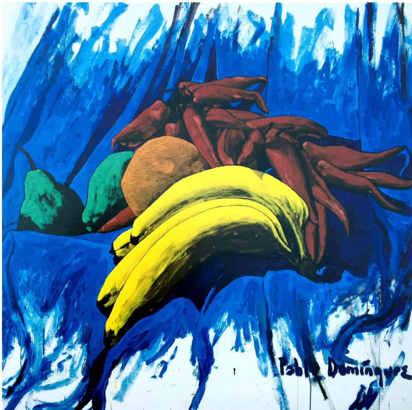
Naturaleza Muerta 1 Acrílico sobre tela 163 x 164 cms. 1996