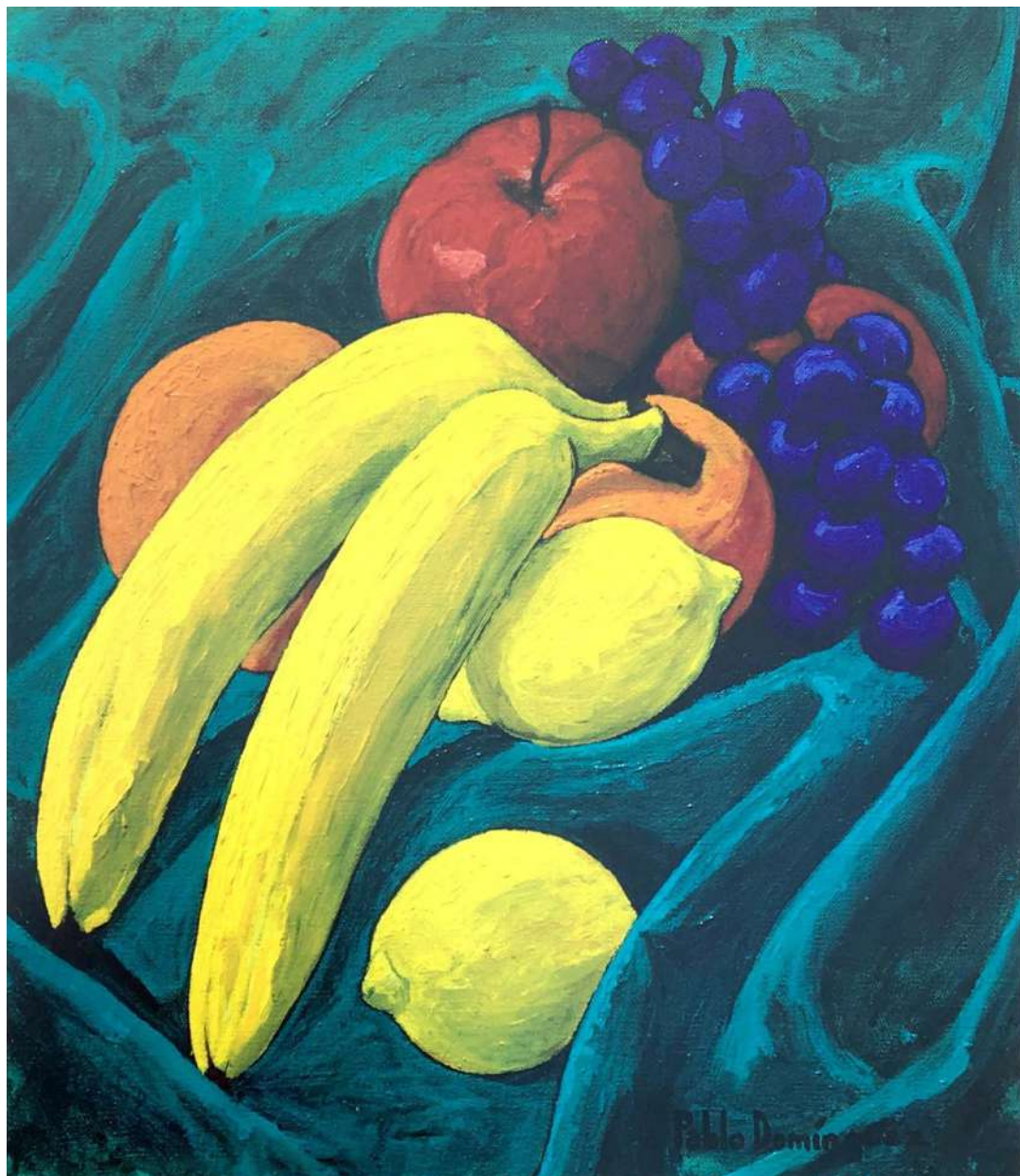
Sobre el tapete Acrílico sobre tela 40 x 35 cms. 1996