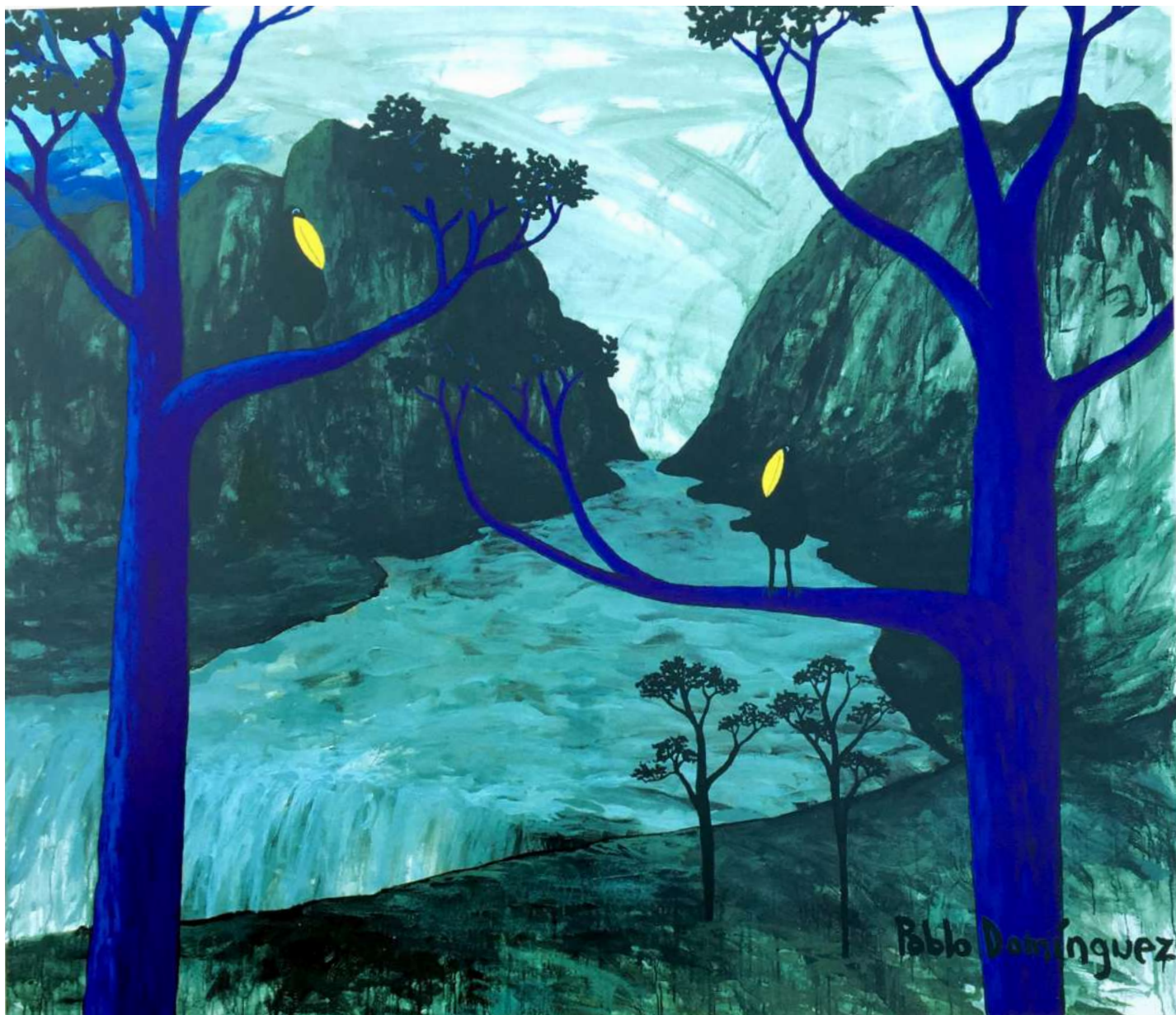
Sin Título Acrílico sobre tela 175 x 193 cms. 1996