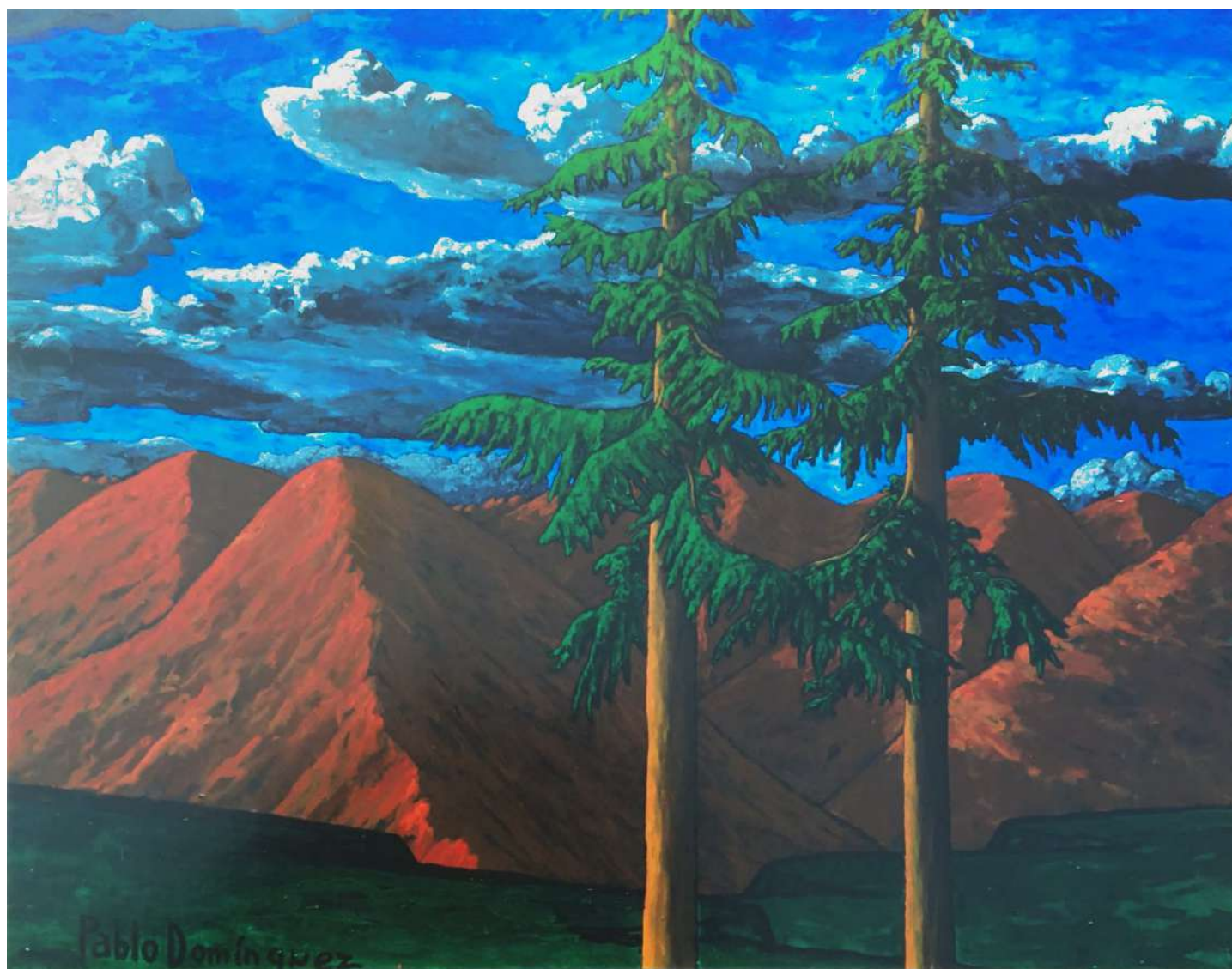
Paisaje Acrílico sobre tela 163 x 205 cms. 1996