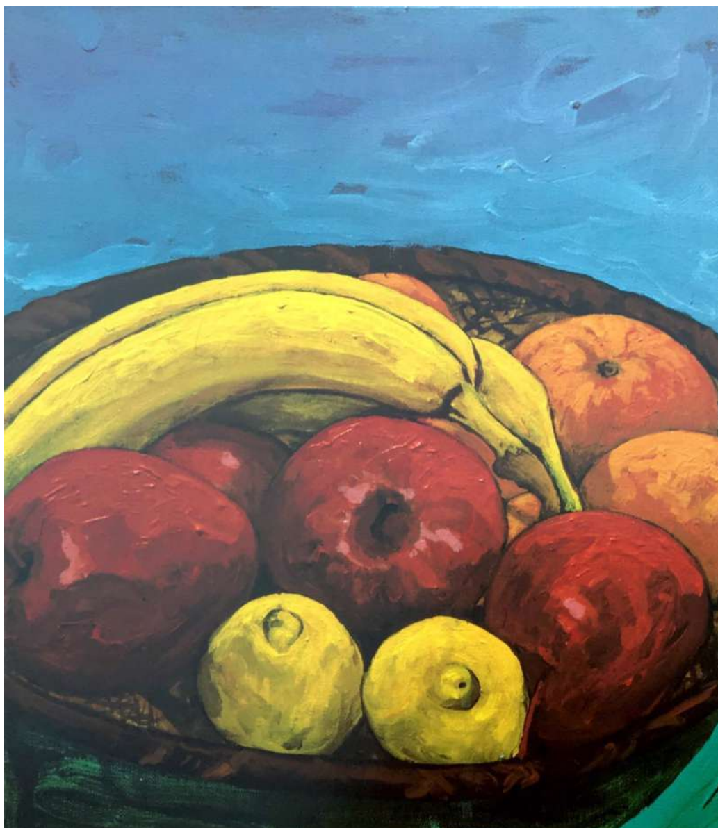
Las frutas en la panera Acrílico sobre tela 40 x 35 cms. 1996