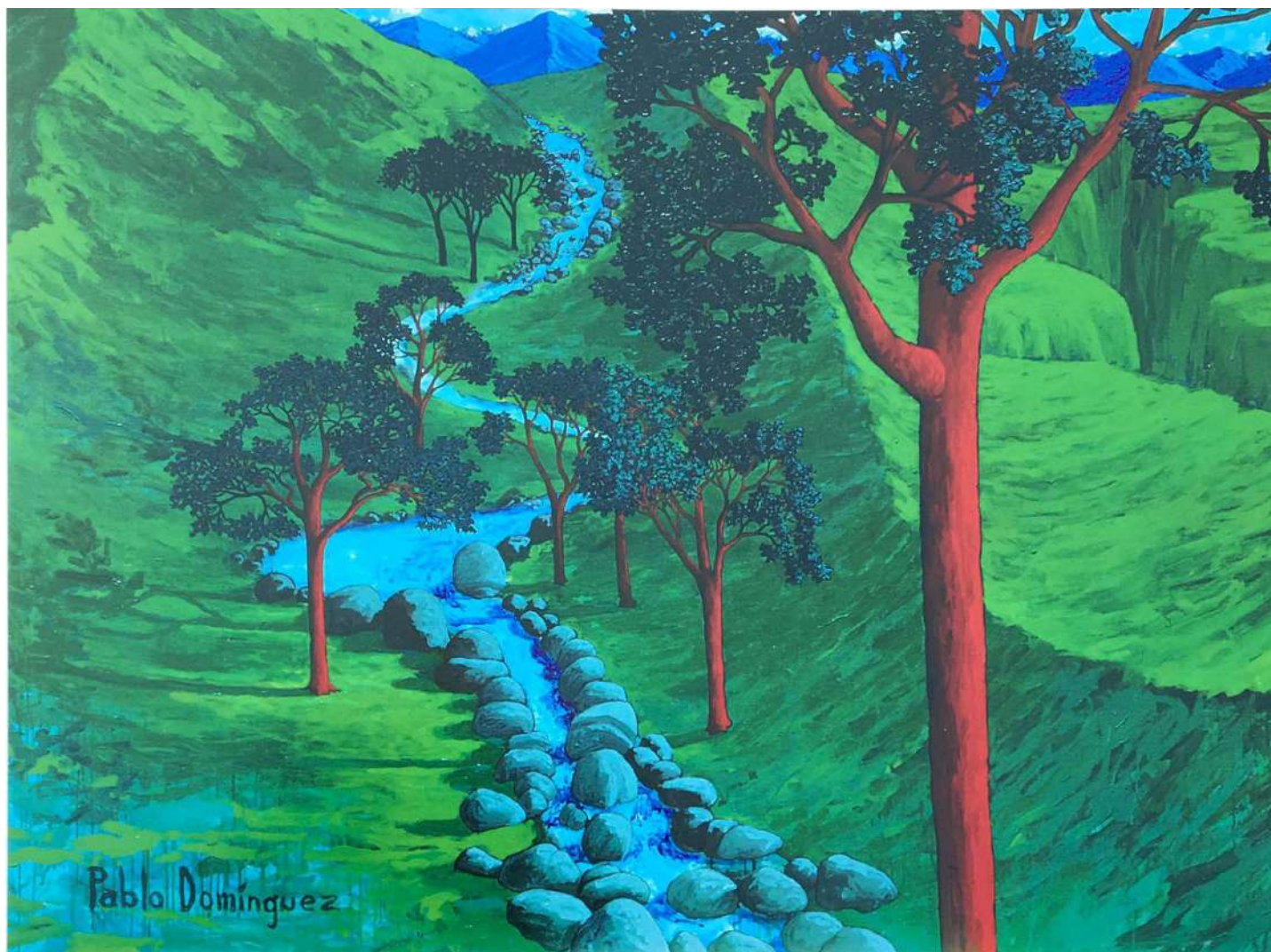
Río Arriba Acrílico sobre tela 164 x 219 cms. 1996