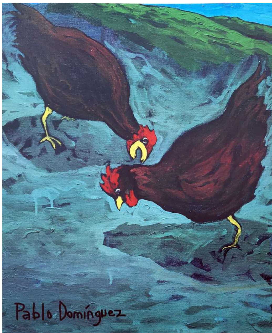
Dos Gallinas Acrílico sobre tela 61 x 50 cms. 1996