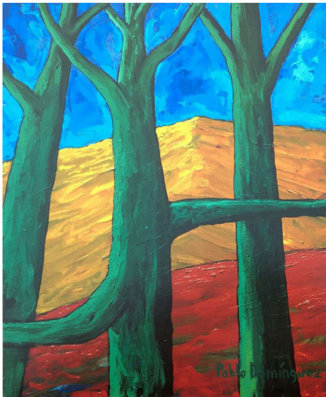
Composición Acrílico sobre tela 60 x 50 cms. 1996