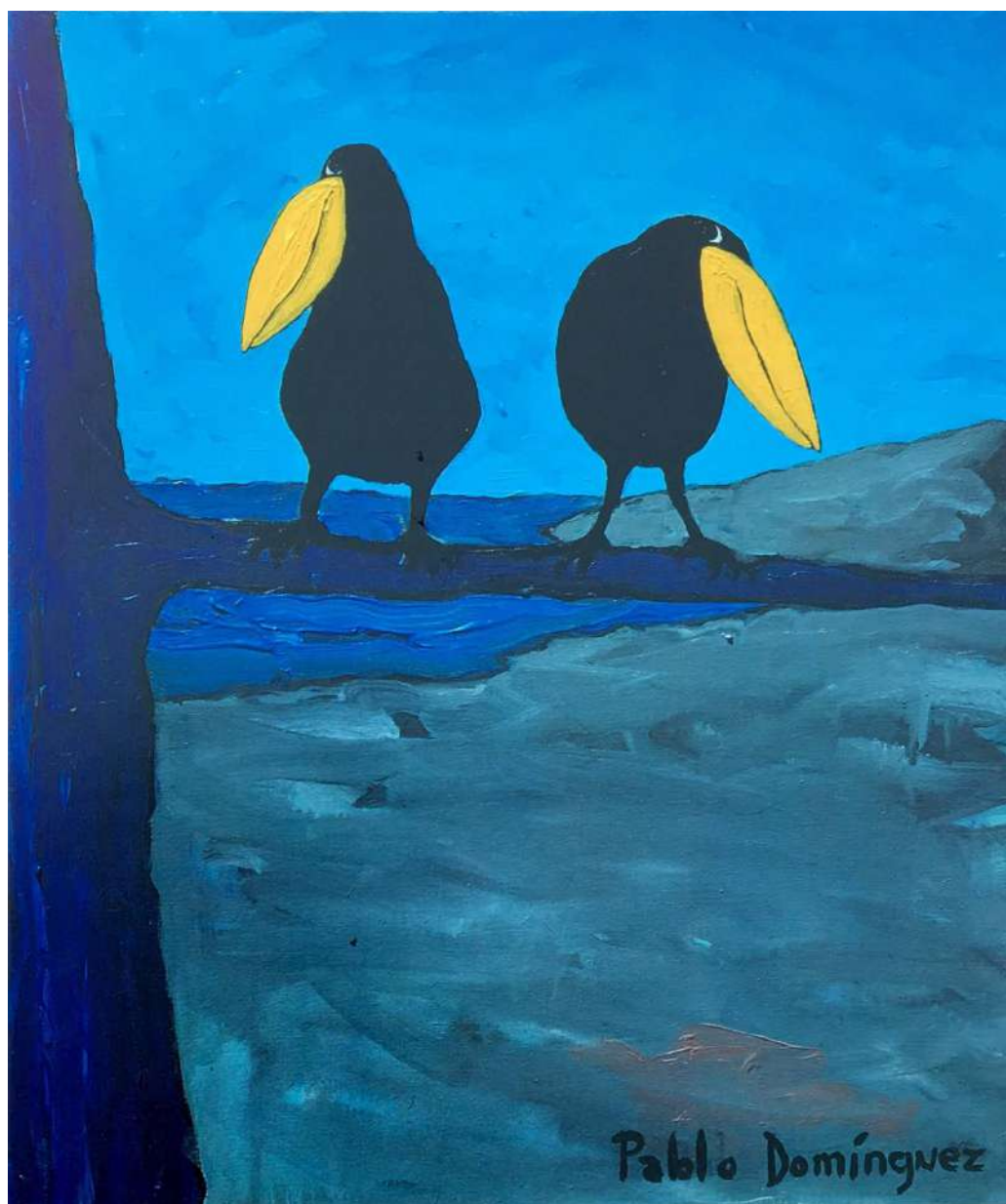
Las Urracas Acrílico sobre tela 60 x 50 cms. 1996