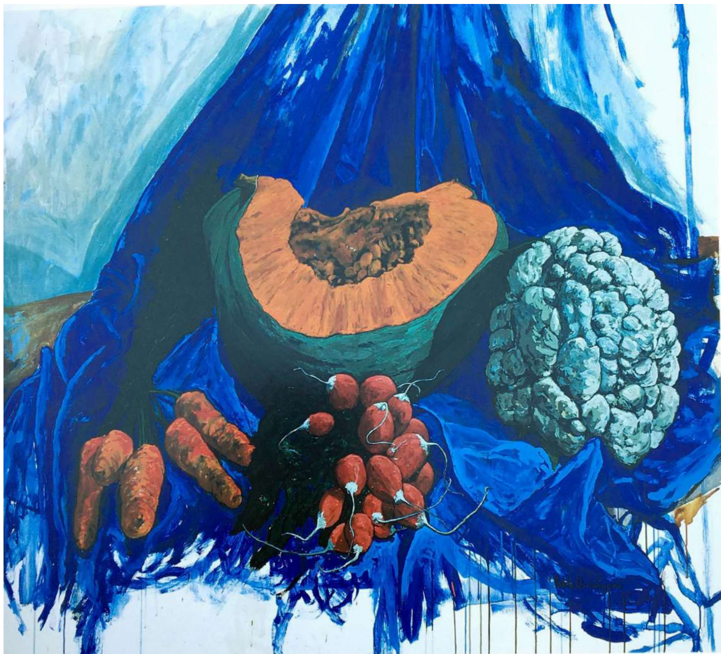
Naturaleza Muerta 2 Acrílico sobre tela 175 x 190 cms. 1996