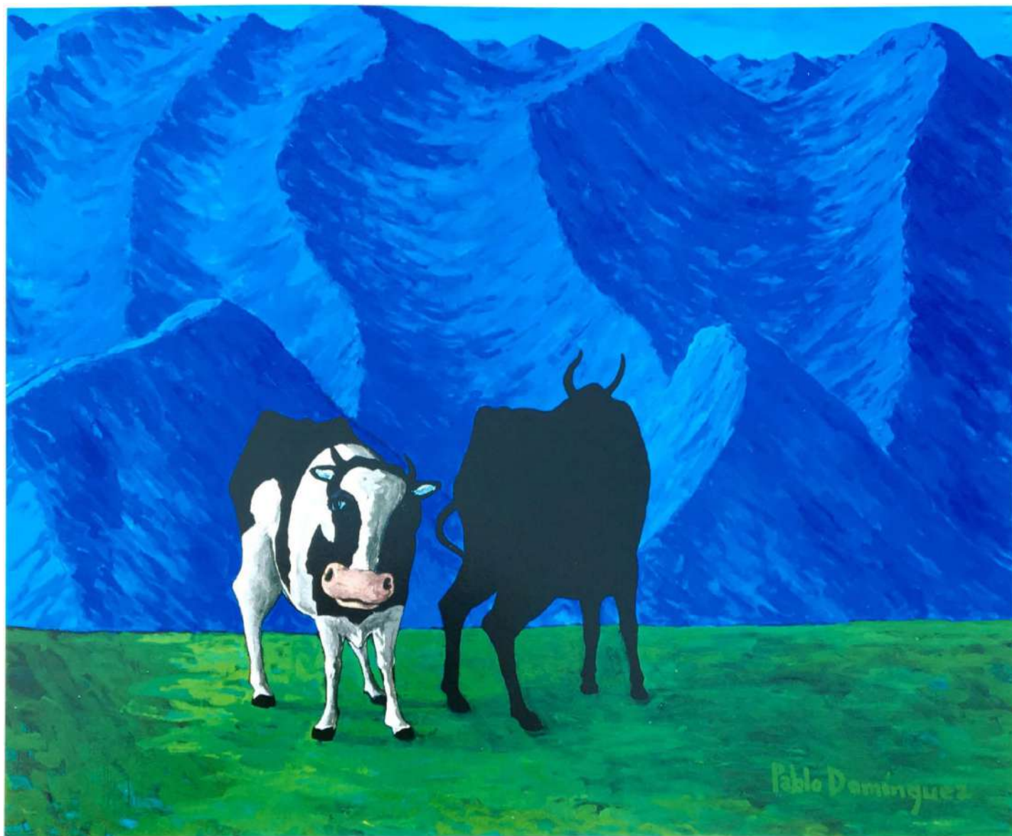
Sin Título Acrílico sobre tela 165 x 197 cms. 1996