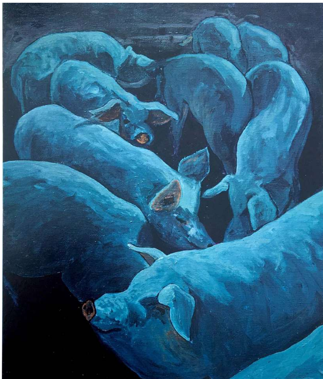
La Piara Acrílico sobre tela 65 x 54 cms. 1996